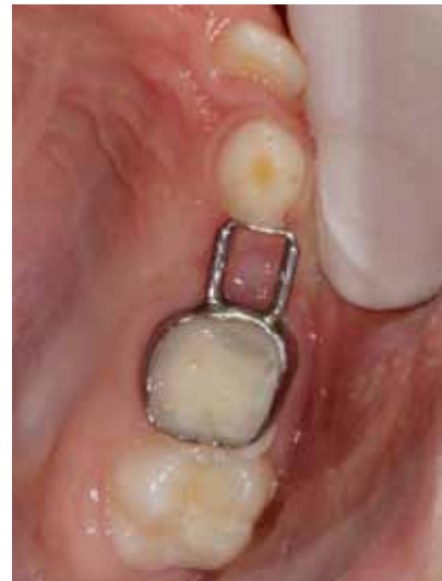
Abb. 4 Zementierter Platzhalter

Ein leidiges Thema bei Kindern ist das Schnullerlutschen. „Auch wenn die Industrie sich mit derzeit 3, vordem 4 Saugergößen an das Wachstum der Kinder anpasst, werden Lutschgewohnheiten deshalb nicht weniger schädlich. [...] Als derzeit größtes Problem muss wohl die Abkehr von der Nutzung als alleiniger „Beruhigungs“ – sauger angesehen werden. Vielmehr wird das Straßenbild durch lutschende Kinder bis in die Vorschulzeit geprägt. [...] Deshalb stellt ein Festhalten an Lutschgewohnheiten nach