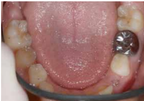
Abb. 3 Konfektionierte Stahlkrone

Wie bereits erwähnt ist die wichtigste Maßnahme die Aufrechterhaltung der strukturellen Integrität des Milchzahnes, um ausreichend Platz für die nachkommenden Zähne zu gewährleisten. Die einfachste Methode ist die Füllungstherapie oder bei größeren Defekten die Versorgung mittels konfektionierter Stahlkrone (Abb.3). Sollte ein Zahn durch Karies „verloren gegangen“ sein, muss ein Platzhalter diesen Raum freihalten. Dies kann entweder in Form eines zementierten Stahlbandes (Abb.4) oder bei Fehlen von mehreren Zähnen, mittels einer Platzhalter-Zahnspange erfolgen.